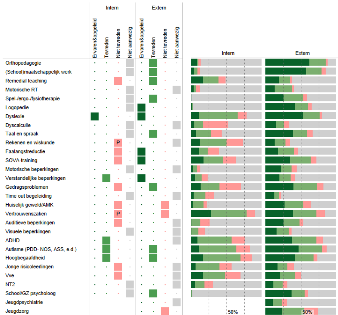
Gemiddelde alle scholen